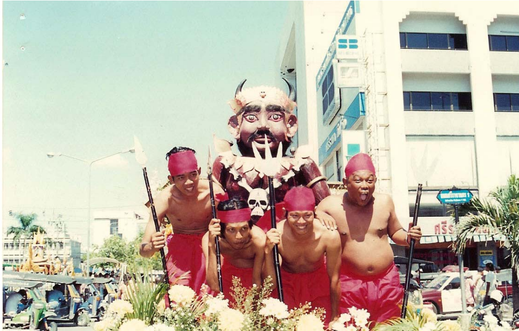
ภาพที่ ๖๐ ขบวนแห่พญายม

อย่างไรก็ตามเมื่อการเมืองท้องถิ่น ได้เข้ามาสนับสนุน งานสร้างและแห่พญายม ทำให้ การสร้าง – การแห่ และการปล่อยพญายม ทำกันได้อย่างมีรูปแบบ และพิธีการมากขึ้น และมี ผู้มาร่วมงานทั้งกลุ่มชน ที่เป็นชาวบ้านและหน่วยงานราชการ มาร่วมงานมากขึ้น ทั้งตำบลบางพระ และประชาชนในจังหวัด ชลบุรี จนกลายเป็นประเพณี ของชาวตำบลบางพระ ไปแล้ว มิใช่เป็นแค่ การจัดงานของกลุ่มชนสองฝั่ง คลอง แบบแต่เก่าก่อนที่เคยทำกันมา