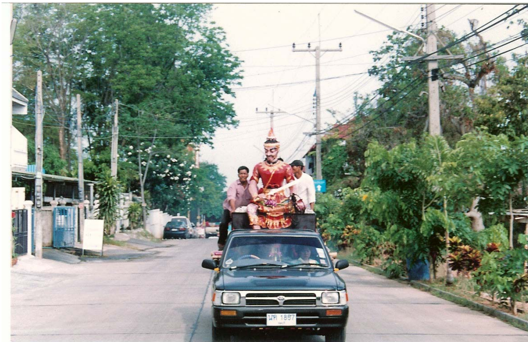
ภาพที่ ๖๗ นางค์พญามเข้าร่วมขบวนแห่