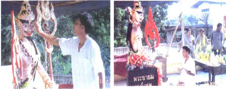
ภาพที่ ๖๔ พิธีเบิกเนตร

(ภาพจากงานวิจัยโครงการสืบค้นประเพณีแห่พญายม หน้า ๓๘)