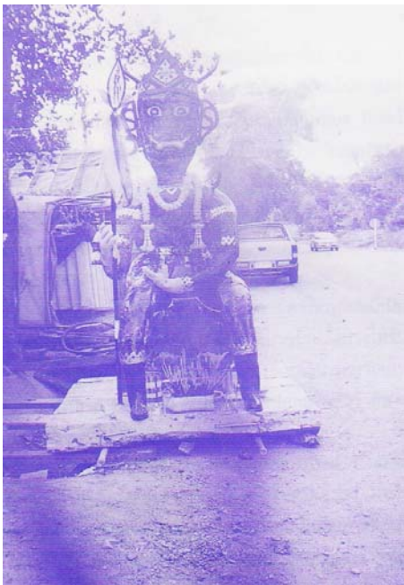
ภาพที่ ๕๑ พญายมปี ๒๕๔๑