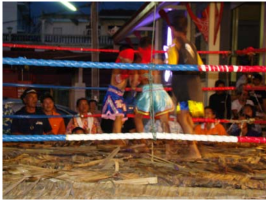
ภาพที่ ๗๐ มวยตบจาก