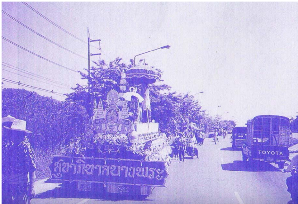
ภาพที่ ๕๗ รถขบวนแห่พญามของสุขาภิบาลบางพระ (ภาพจากหนังสือที่ระลึกงานฉลองศาลเจ้าแก่งเข็ญไ้ให้โป๊ยเซียนโจ้วซื่อ บางพระ ตำบลบางพระ อำเภอศรี ราชา จังหวัดชลบุรี หน้า ๖๐)