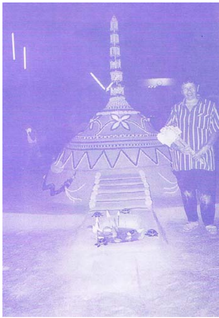
ภาพที่ ๕๕ การก่อพระทรายในอดิเตด (๑)