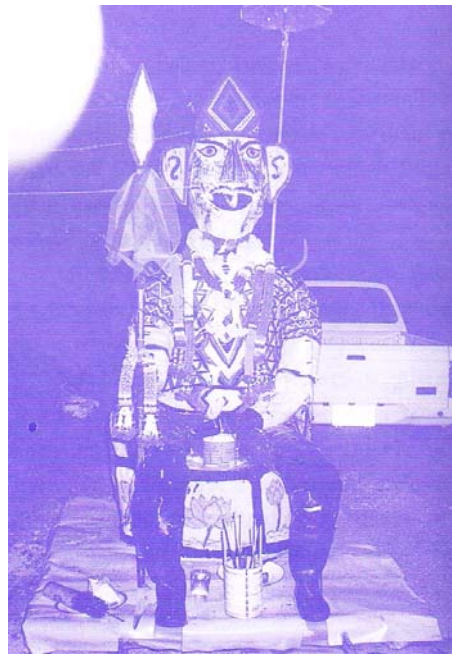
ภาพที่ ๕๒ พญายมปี ๒๕๔๒ (ภาพจากหนังสือที่ระลึกงานฉลองศาลเจ้า แก่งเขียงไต้โป๊ยเซียนโจ้วซื่อ บางพระ ตำบลบางพระ อำเภอศรีราชา จังหวัดชลบุรี หน้า ๕๘)