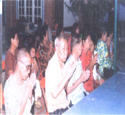
ภาพที่ ๖๕ กิจกรรมในวันสุกคิบ

(ภาพจากงานวิจัยโครงการสืบค้นประเพณีแห่พญายม หน้า ๓๘ - ๔๐)