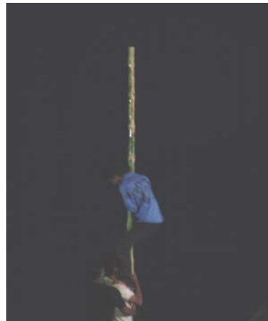
ภาพที่ ๗๓ ป็นเสาน้ำมัน