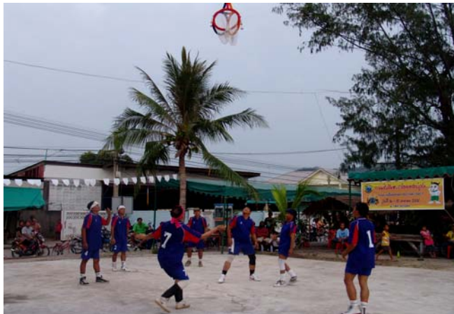
ภาพที่ ๗๒ ตะกร้อลอดบ่วง