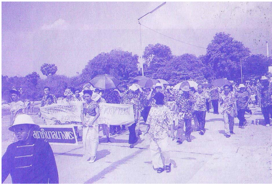
ภาพที่ ๕๘ ขบวนแห่พญายมของสุขาภิบาลบางพระ