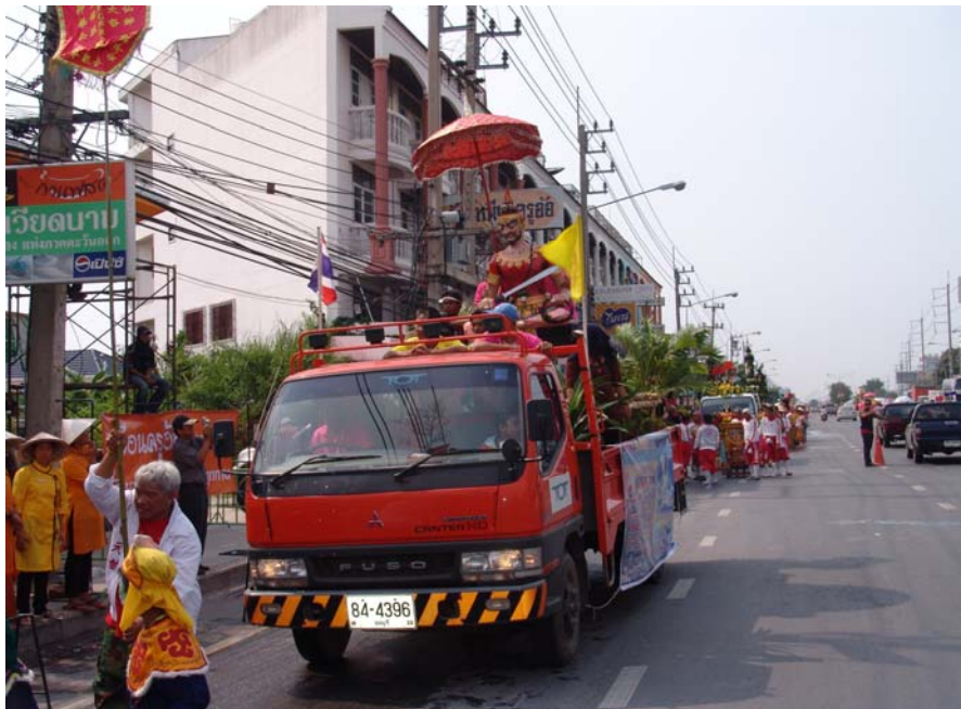
ภาพที่ ๖๙ ขบวนแห่พญายม (๒)