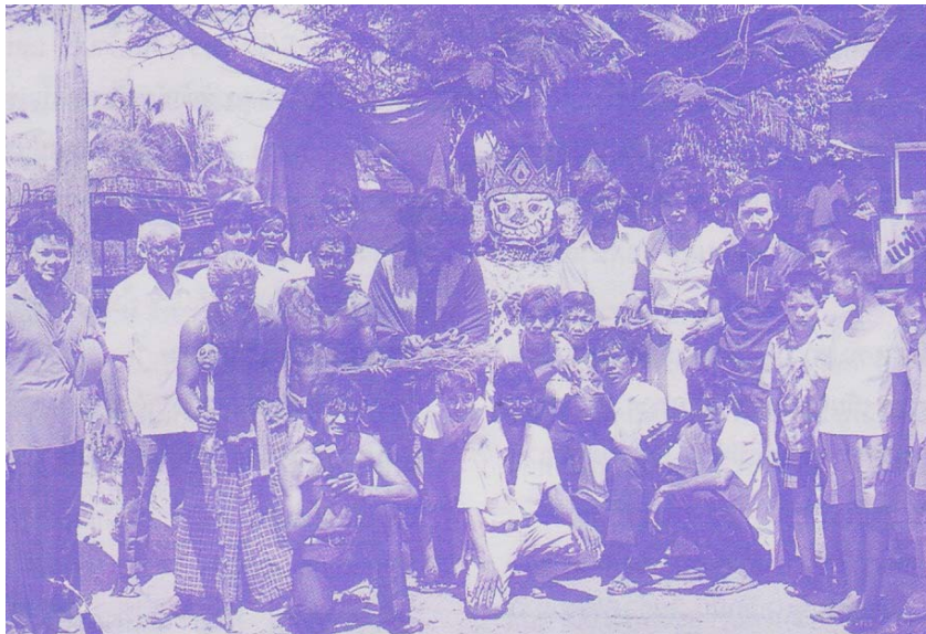
ภาพที่ ๕๐ พญายมปี ๒๕๒๒

เมื่อมีการทำองค์พญายมที่คอเขาพระบาทบางพระ จึงมีการทำบุญเข้าที่นี้ มีการก่อ พระทรายน้ำไหล และฉลองพระทราย ส่วนภาคบ่ายเป็นประเพณี แห่พญายม และงานกองข้าว ของชาวสองฝั่งคลอง ซึ่งถือว่าเป็นวันสุดท้ายของสงกรานต์ บางพระด้วย