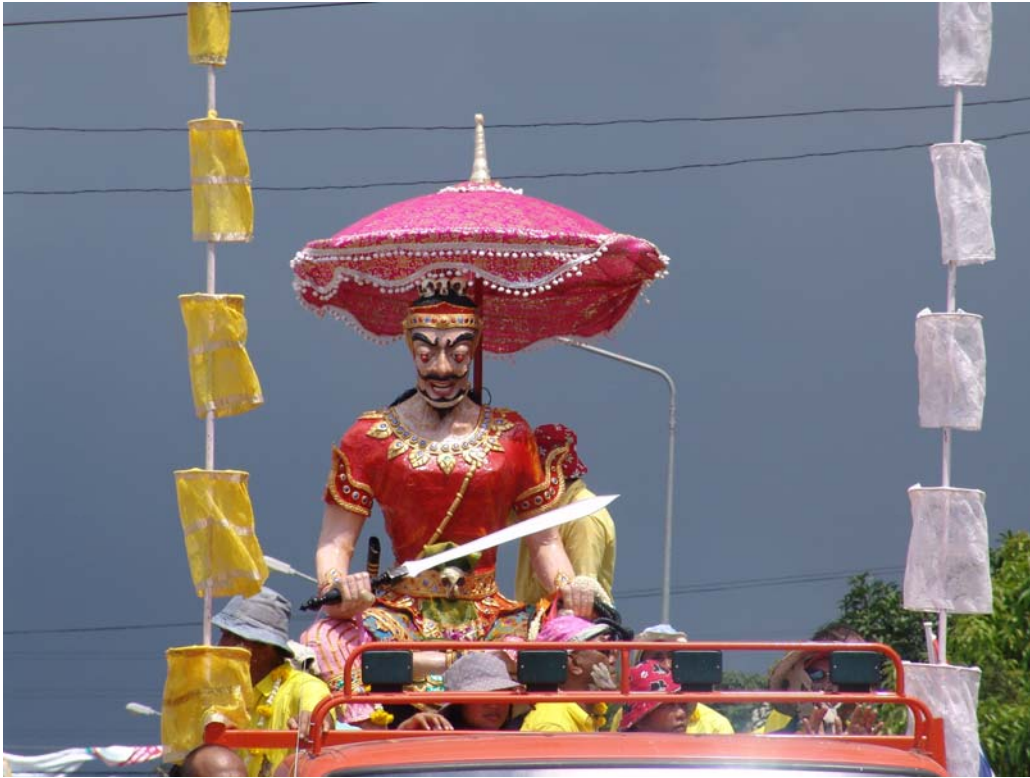
ภาพที่ ๖๘ ขบวนแห่พญายม (๑)