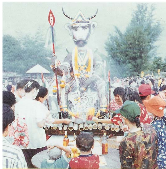
ภาพที่ ๕๔ พิธีวงสรวงพญายม