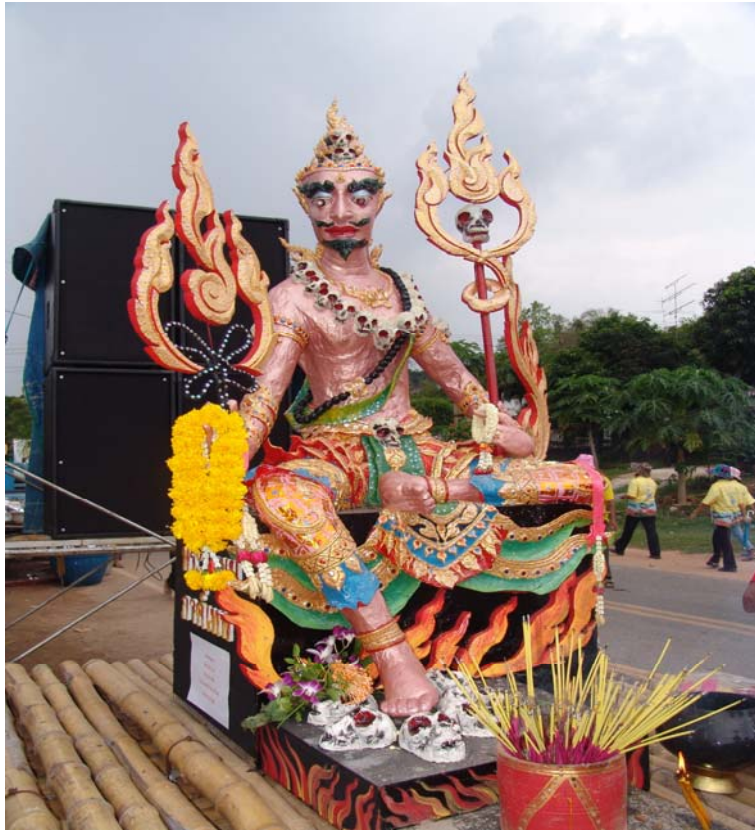
ภาพที่ ๖๖ นางค์พญามตั้งไว้กลางลานบ้านเพื่อทำพิธีในวันสุกดิบ