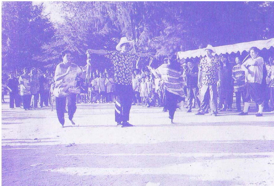
ภาพที่ ๕๙ วิ่งเปี้ยว (กีฬาพื้นบ้าน) (ภาพจากหนังสือที่ระลึกงานฉลองศาลเจ้าแก่งเยี่ยงไต้ไต้เขียนโจ้วซือ บางพระ ตำบลบางพระ อำเภอศรี ราชา จังหวัดชลบุรี หน้า ๖๐)