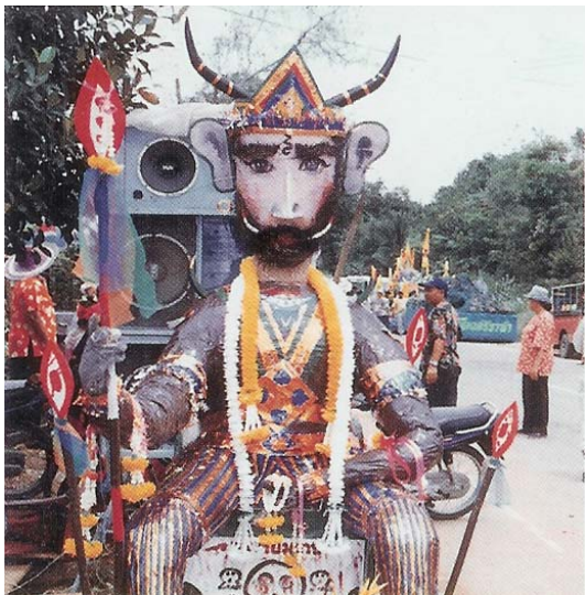
ภาพที่ ๕๓ พญายมปี ๒๕๔๓