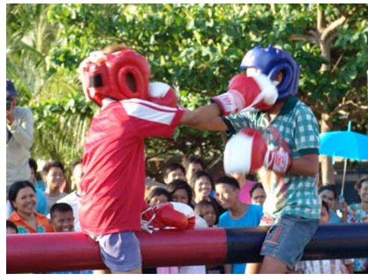
ภาพที่ ๗๑ มวยทะเล